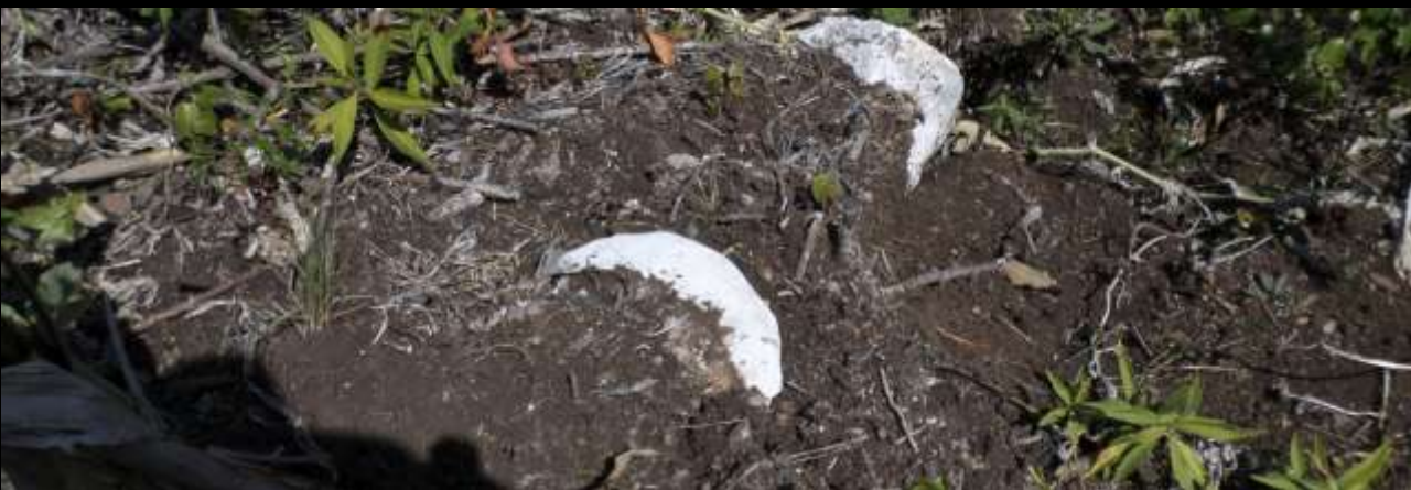
Fotografías tomadas en La Cuesta, Veracruz, México. Entre enero a agosto 2014.