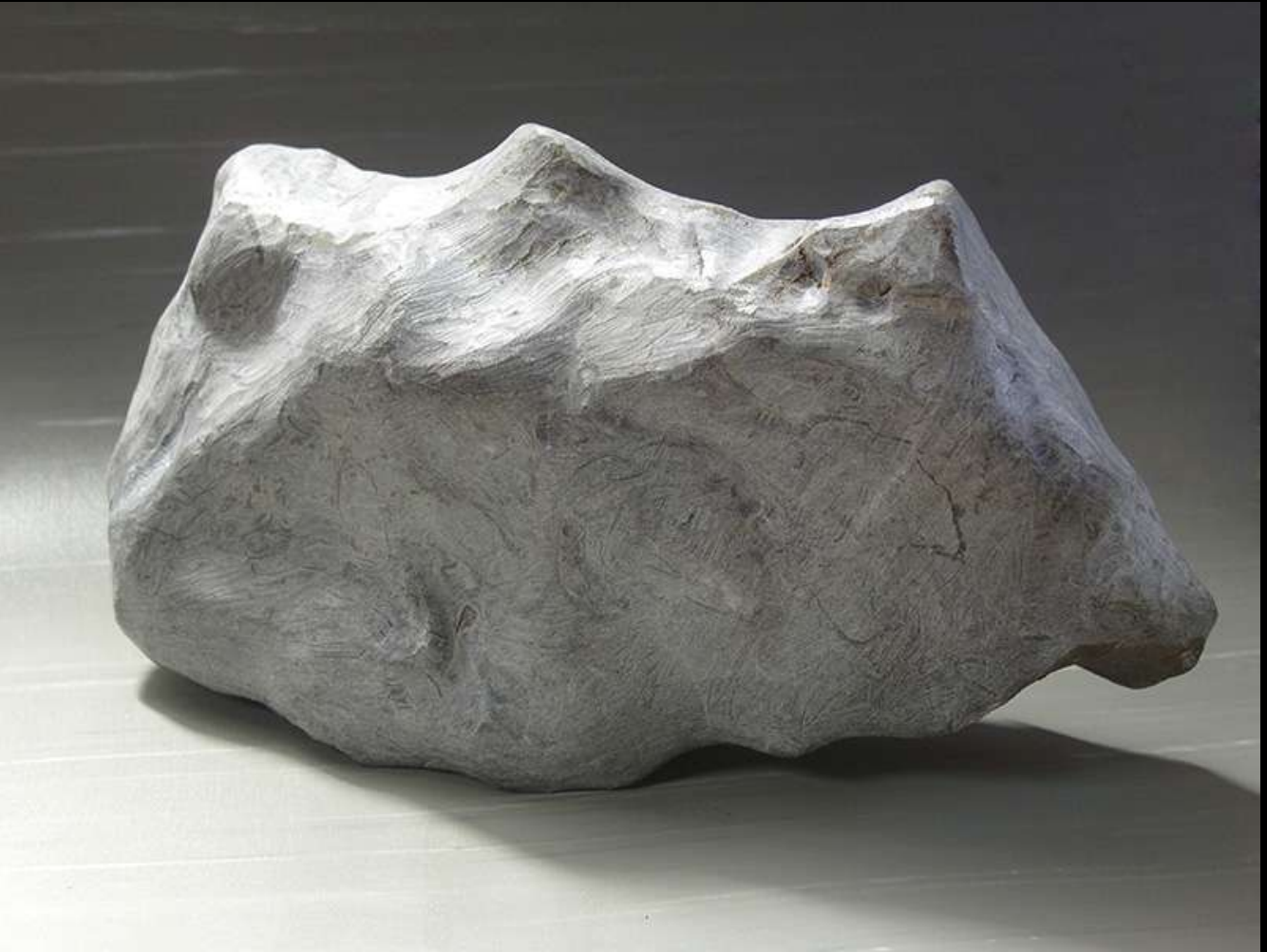
(Arriba) Pie. (Abajo) Cordero