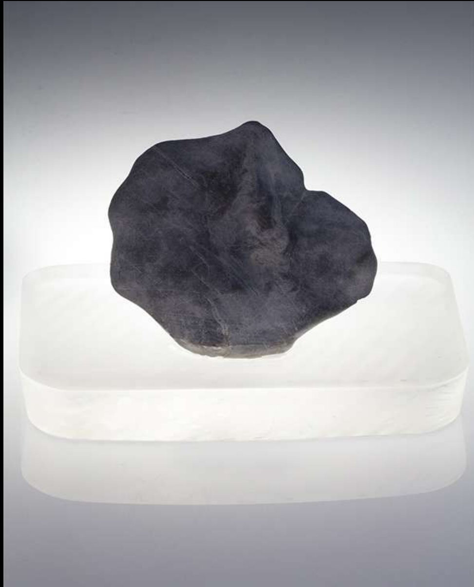
Flor de mar