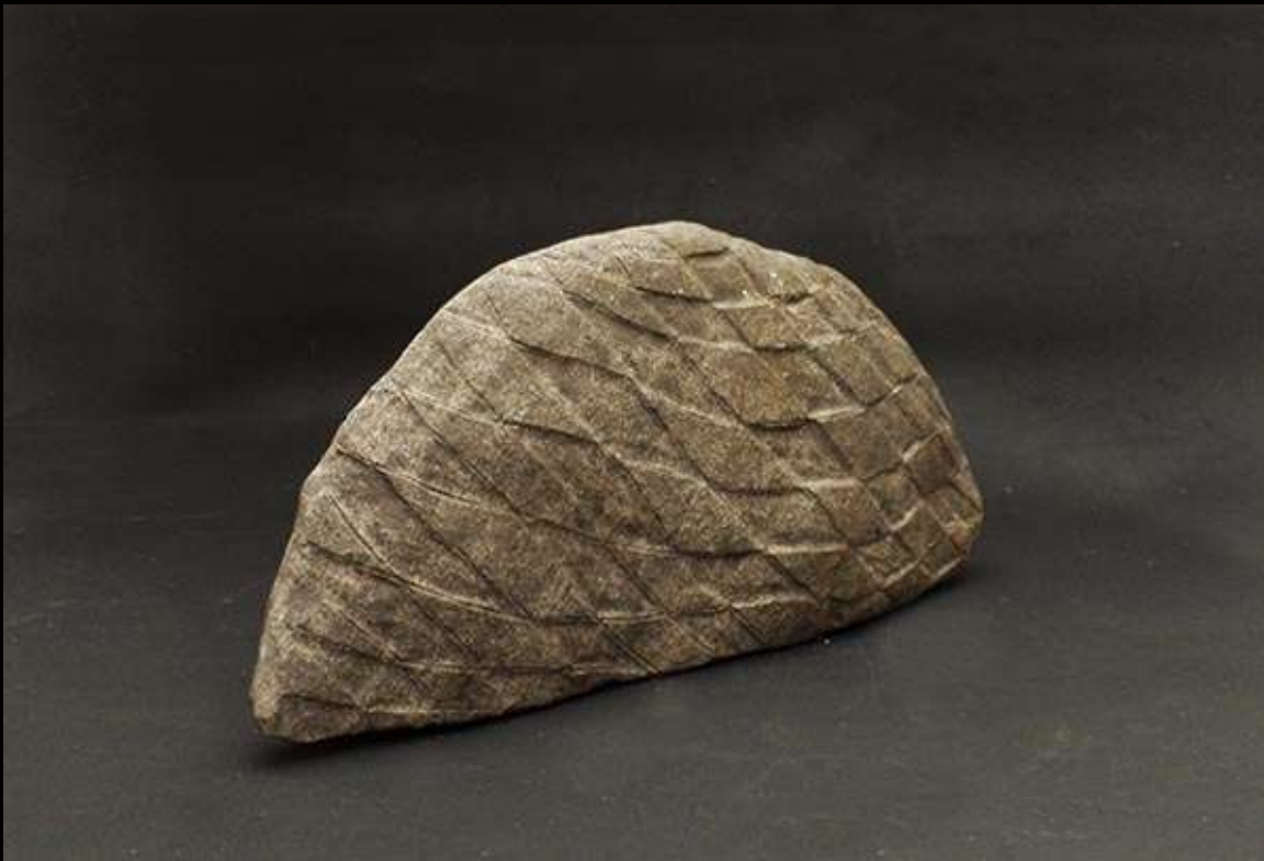
(Arriba) Chacmol. (Abajo) Coraza