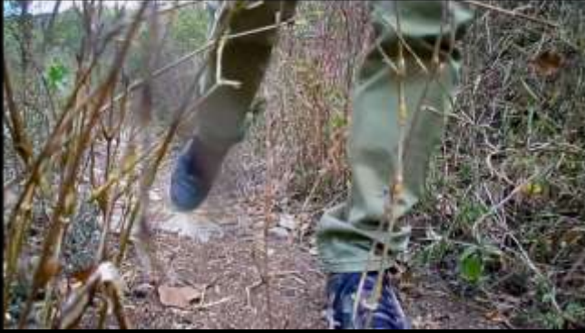
Imagen del recorrido. 11, de febrero de 2014 Periferias de la montaña La Cuesta.

Proyecto escultórico basado en el uso de piedra como material soporte de la obra. Consiste en la elaboración de esculturas realizadas con piedra caliza, donde la constante y obsesiva selección de los materiales juegan un papel importante.