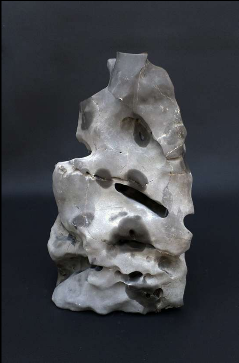
Hipocampo de mar